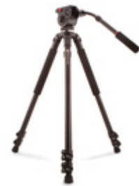
Trépied Professionnel VT-16 Fluid PCPT1601