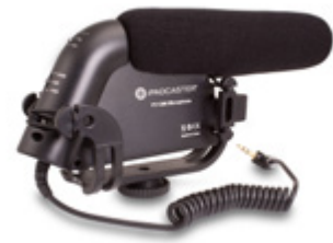
Microphone Shotgun PCYT1300

Optimisez votre expérience Padcaster en ajoutant des accessoires