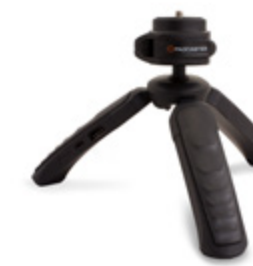
X-POD Mini Trépied Pistolet avec Grip de Maintien PCXPOD01