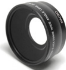
objectif grand angle PC58WAL01