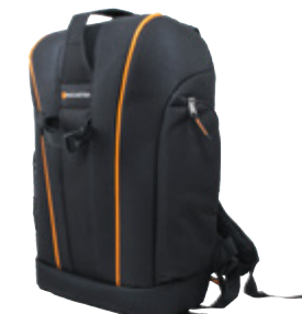
Sac à Dos Padcaster PCBKPK001