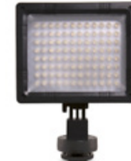
Torche LED XP-38 PCXP38