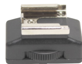
griffe porte-accessoires CSA001