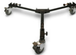
Roues Servantes pour Trépied VT-16 Fluid PCDW001