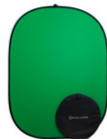
Fond Vert Pliable PCGS01