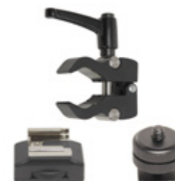
Kit Fixation Trois Accessoires PCCLSYS01