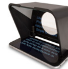
Mini Teleprompteur PCPTP01