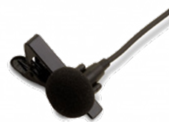
Microphone Cravate PCLAV001