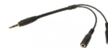
Doubleur stéréo jack 3.5mm PCDMSP01